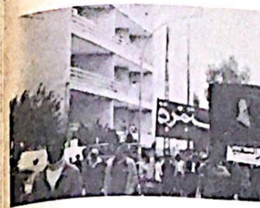
وكأنه غزاه .. وكان

واكثر من الكلمات ، ومن هنا جئنا لتجديد المهد لجيفارا ورفاقه وكل الشهداء ، ونقول ان هذه الثورة رغم المؤامرات التي تحالط عدوها ورغم ان هذه المؤامرات لا تعصر على العدو الصهوي . وضربانه الملاحه في كل مكان ، وانما مع الاسف هناك بعض الادي الغربية ، التي تحاول ان تاسر على هذه الثورة رغم انها هي الوحدة التي عدم الشهداء وهي الوحدة التي تحرق الصمت على كثير من الجبهات ، هذه الثورة التي عدم كل يوم الشهداء ولو الشهداء هي محسوده على هذا الحدت الذي عدمه من خيره اسائها ، سأمرون على حق والنصر . واحسم كلمه مناشدا جميع القوى الثورية