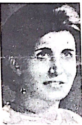
مقتيلة « ابو يوسف » استشهدت مع زوجها

ان مجرد جرد لعمليات الثورة الفلسطينية داخل الارض المحتلة التي حدثت داخل المدن الاسرائيلية ، والاشتيابات على الحدود يثبت مدى عجز الالة الصهيونية عن مواجهة ضربات الثورة الفلسطينية في الداخل . وفي نفس الوقت يطي الدليل على نمو وبقاء الثورة الفلسطينية صامدة وقادرة على