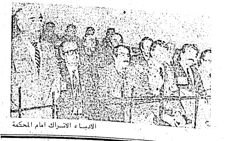
الادباء الاتراك امام المحكمة

ناظم حكمت حقا لايقر للفاشيات في العالم اي قرار مالم «تقتل»، وتقمع وتعتقل... فهو القانون الذي يحكم هذه الانظمة في عرض العالم وطوله. في الصورة يظهر الاديب التركي الكبير «يز نيس» وهو من الكتاب الذين ذاعت شهرتهم عالميا والذي ترجمت اعماله الى 40 لغة.