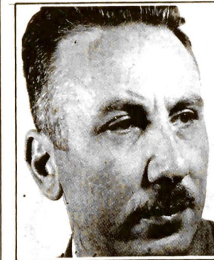
الشاعر نزار قباني

تلك العوامل آتت ساهمت في انتشار القصيدة المقاومة انتشار النار في الهشيم ، نار الناصر الفلسطيني في هشيم الانظمة العربية وهزائمها . تلك العوامل ذاتها كان لها اثر سلبي ايضا في بذية القصيدة العربية الحديثة في ظل الاحتلال الصهيوني .