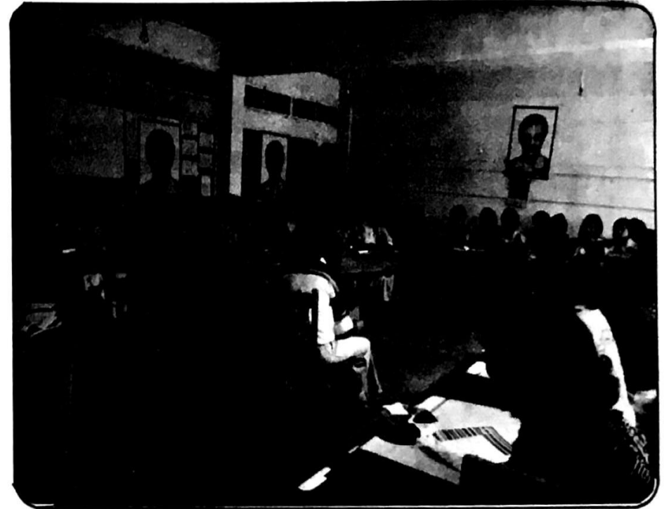
جلسات خاصة بمناقشة اغاني الاطفال والالعاب الرائجة بينهم