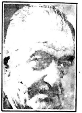
رشاد الشوا يؤيد اتفاقيات كامب ديفيد وينصح منظمة التحرير بتأييدها

الكامل والحقيقي للقوات الاسرائيلية من الاراضي العربية المحتلة واعطاء الشعب الفلسطيني حقه في العودة وتقرير المصير وانشاء دولته الحرة والمستقلة على ارضه العربية كما ان اسلام في هذه المنطقة الا بممارسة السيادة العربية الفلسطينية على القدس والضفة الغربية وقطاع غزة بكل ما تعنيه السيادة من معنى .