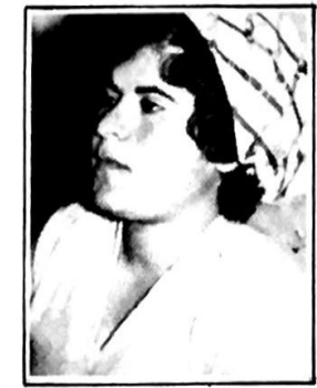
من عائلة معصومه منعم