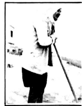
من عمال رصف الطريق