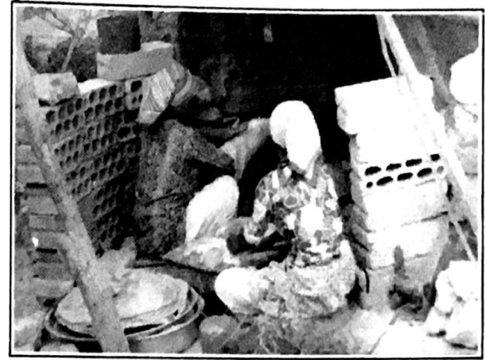
المواطنة عفيفة المليجي وزميلتها فاطمة الدر... نموذج لحياة المهجرين