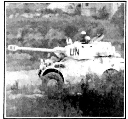
مصفاة فرنسية على طريق صديقين اثناء الاشتباكات مع القوات الوطنية

الدولية لم تنفذ مهماتها واتهمها بانها تتعاون مع المقاومة ( ... ) . كذلك اتهم الناطق الاعلامي باسم الكتبية الفرنسية الثامنة للمظليين «الكومندان دولا روشير» الميليشيات بانها تعرق مهمة قوات الطوارئ الدولية في الجنوب عبر تواجدها قرب المراكز الدولية في قرى الخط الثاني خصوصا في الناقورة . وذكر ان اتفاقا قد تم بين الجيش اللبناني واسرائيل والقوات الدولية يقضي بالسماح للميليشيات بالتحرك ضمن هذه المنطقة لكن بدون اسلحة ( ... ) .