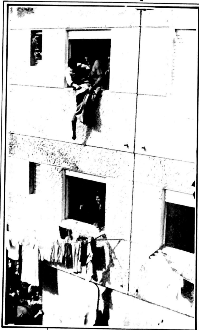
عندما عادوا ، يحملون نارا ، ذعر المستعمرون الذين ظنوا ان البيوت الطينية غابت ، وان اسمنت واصباح بناياتهم نجت في تمويه جريمتهم ... الفدائيون فجروا المستعمرة ، اقتلعوا الطمانينة من قلوب المستعمرين .. وعندما تهاوت المستعمرة وفاح عير البيوت الفلسطينية الموقودة .. لم يملك الاعداء سوى التمثيل بحثة الشهيد الفلسطيني الذي تركها الى جانب جثة المستعمرة ومضى يعانق فلسطينية الارض ..