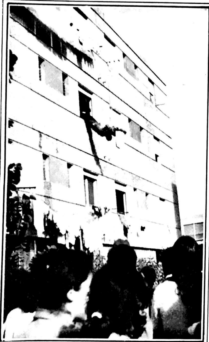
الجنة تقذف من الطوابق العليا الى عشرات المستعمرين الذين وجدوا انفسهم فجأة امام الحقيقة : حقيقة كونهم مجرد مستعمرين يعيشون في ارض ليست لهم ، ومستقبلهم على كف عفريت ...