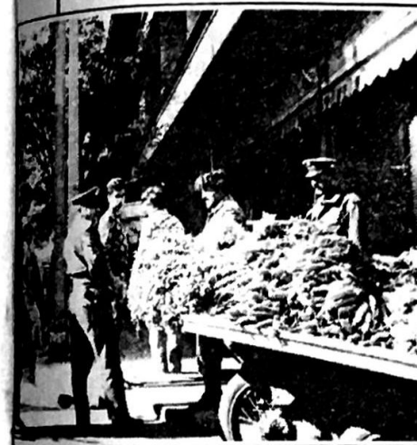
الغيب يتحاور مع بائع على عربة خضار...