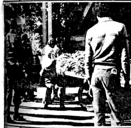
ويغرس حربة السدفة في الدولاب بعد فشل الحوار

□ يبدو ان « قلة الترتيب » وانعدام « المظهر السياحي الجيد » هما وراء غلاء الاسعار و « تفرّكش » الوضع الامني والاقتصادي . هذا الاستنتاج توصلت اليه كما نرى في الصورتين اعلاه دورية من قوى الامن الداخلي بقيادة احد ضباط مخفر حبيش . فقد قامت هذه الدوريات « بمفاجأة » بائعي الخضار المصطفين في منطقة العمراء وعملت على بقر دواليب عرباتهم بحربات النادق امعانا منها في « حل الازمة التي تمر بها البلاد » . ومسكين من لا يضع في عربته كلاشكوفًا .