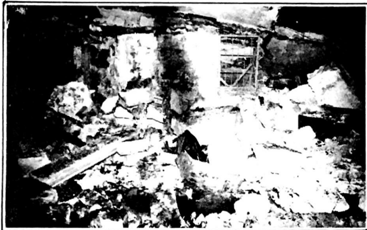
آثار الغارة الوحشية