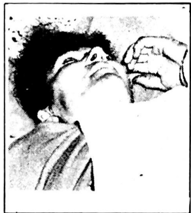
الشهيدة مهجرة من يارين

في تمام الساعة الثالثة الا الربع من بعد ظهر ٢٠-١٢-١٩٧٨ تعرضت مناطق برج الشمالي - شارقية - العاقبية - الصرند - القاسمية لغارة جوية صهيونية وحشية قامت بها ٢ طائرات معادية من طراز فانتوم . واسفرت الغارة عن استشهاد مواطنين وجرح ١١ آخرين بالإضافة لتدمير عدد من المنازل . هذا وتصدت للطائرات المعادية المقاومة الارضية التابعة للقوات المشتركة الوطنية والتي وصفها شاهد عيان بانها رائسة ، واجبرت الطائرات على الفرار دون ان تحقق اهدافها . وخلال الغارة شوهد العديد من الزوارق الحربية الصهيونية قبالة الشاطئ من الزهراني وحتى مدينة صور .