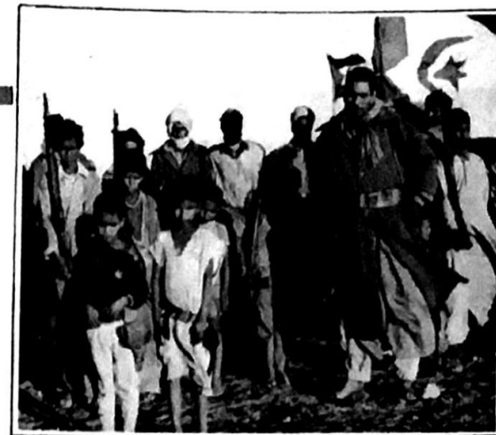
خطوة على طريق انتصار الشعب الصحراوي: