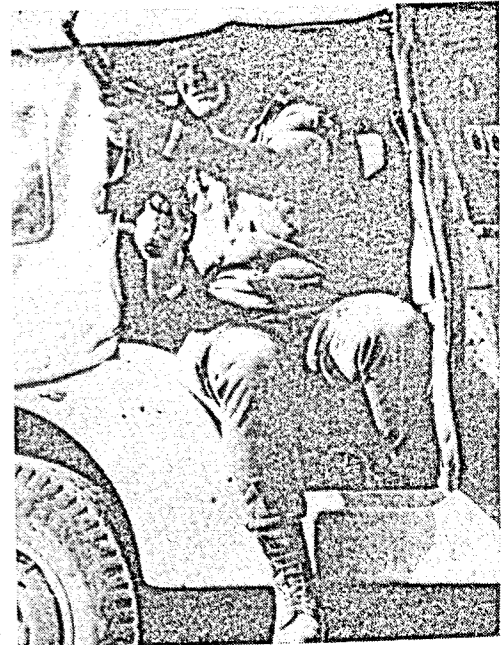
جندي اسرائيلي : قمع الثورة ليس ممكنا