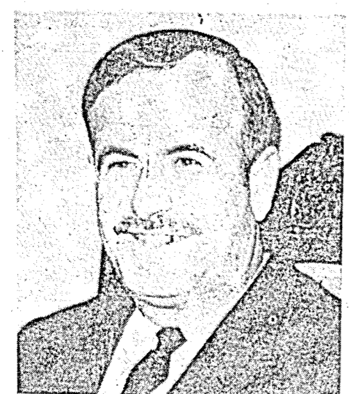
الاسد : رأس المقاومة مقابل بضع كيلومترات

تسع سنوات انقضت على العدوان الاسرائيلي في الخامس من حزيران عام ١٩٦٧ . ذلك العدوان الذي اضاف الى الاراضي العربية المحتلة منذ عام ١٩٤٨ . اراض عربية جديدة تشمل الضفة الغربية كلها وقطاع غزة وسيناء وهضبة الجولان والقطاع الشرقي من مدينة القدس . وقع عدوان الخامس من حزيران عندما قرر الرئيس الراحل جمال عبد الناصر - استجابة لضغط الجماهير العربية - ازالة اثار عدوان اسرايل وبريطانيا وفرنسا على مصر في عام ١٩٥٦ ، وذلك عن طريق اعادة السيادة المصرية الى مضائق تيران ( مما يعني عدم السماح للسفن الاسرائيلية بالمرور فيها ) وطرد قوات الطوارئ الدولية التي كانت تقيد حركة الملاحة في المضائق .