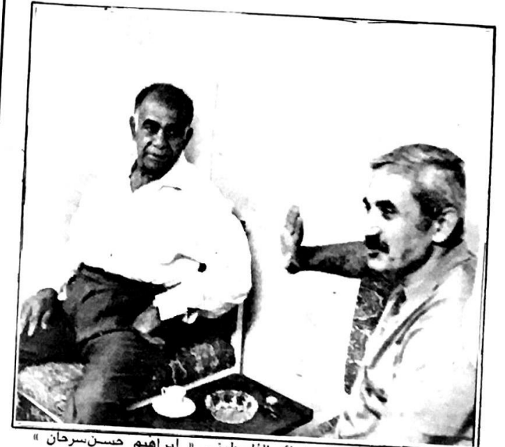
الرفيق جورج حبش مع السينمائي الفلسطيني «ابراهيم حسن سرحان»

● انطلاقاً من ادراك الجبهة الشعبية لتحرير فلسطين لأهمية السينما في مسار الشخصية