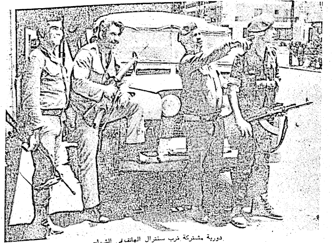
دورية مشتركة قرب سنترال الهاتف في الشياح