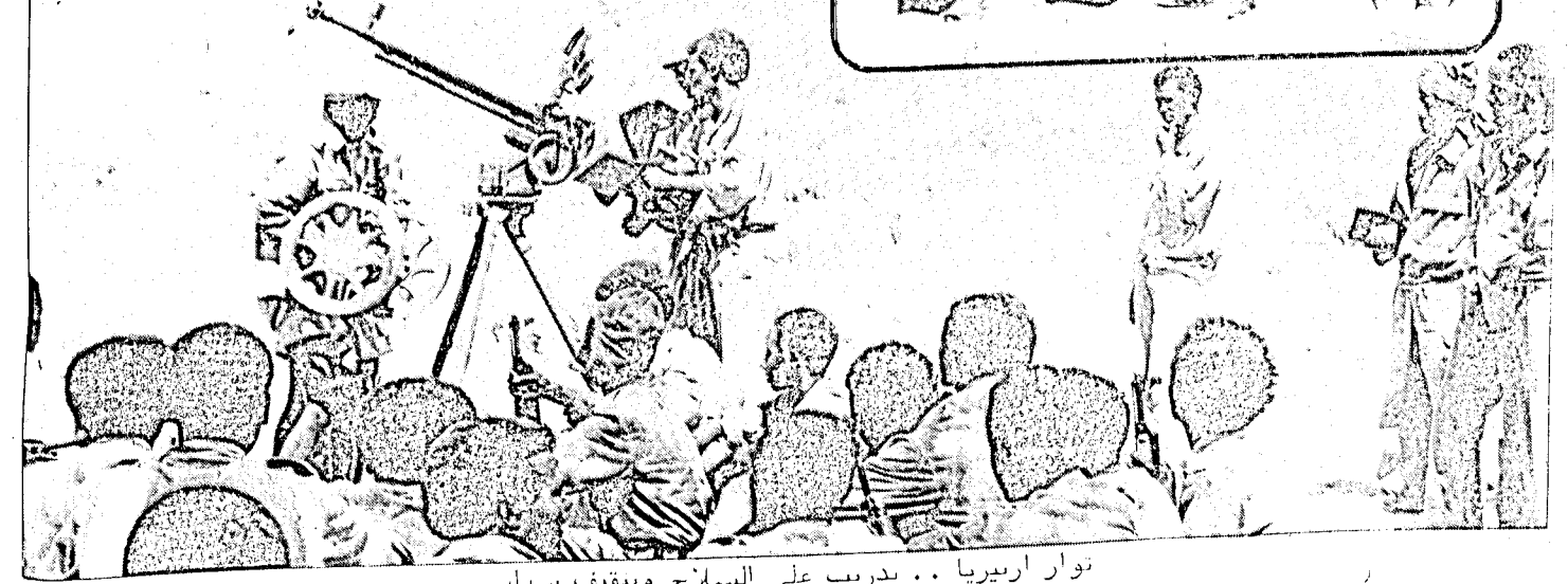
توار ارتيريا .. تدريب على السلاح وسيف سياسي

على تحجيم الثورة الارتيرية مدفوعة بدوافع ربما مختلفه ولكنها تصب في النهاية في مجرى الضغط على الثورة الارتيرية ودفعها الى حل (( مشاكلها )) مع اثيوبيا (( سلميا )) ، ذلك ان قيام نظام حكم ديمقراطي تقدمي في ارتيريا يعني الكثير على صعيد اوضاع المنطقة العربية سياسيا وعسكريا . وخاصة اذا ما اخذت بنظر الاعتبار الروابط التي تربط الشعب الارتيري بالشعب العربي وقضيته القومية والتي ينظر البعض في تقييمها بان يصنف الشعب الارتيري جزءا من الشعوب العربية .