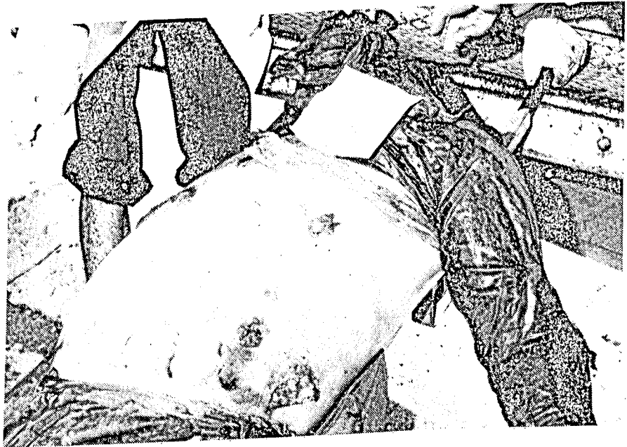
انسانية الكتاب هذه لم تستفز الاقلام التقدمية!

برسم كافة الاقلام الشابكة .. ينتظر الاجابة . ونحن نسجل هذا الموضوع في اذهان القراء العرب لا بد من طرح بعض الموضوعات على هامش ما طرحه الزميل تذكيراً بالحقائق : ١ - ان العزل السياسي لهذا الحزب المتأمر لا يمكن ان يكون محصوراً بالاحزاب السياسية او بقرارات رجال السياسة في هذا البلد ، فالاقلام كل الاقلام التقدمية مدعوة لدعمه على أساس انه جزء من الثمن الذي سيدفعه الكتاب ثمناً لخياتهم للامة في اعز امانها .