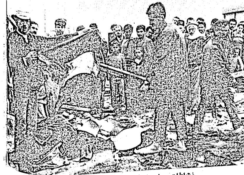
نشاطات بعض الرفاق بعد القصف

سببا رئيسيا في شن هجمات رادعة على هذه القرى . وذلك لوجود بعض المهندسين والغلاة الطائفيين الذين يتحركون في المنطقة بشكل شبه بارز . هذا وقد تجاوز دور الجبهة قرية بقرزلا وامتد لحماية مسيحيي طرابلس حيث قامت الجبهة بفتح مركز لها بطرابلس هدفه الرئيسي والاساسي المساهمة مع القوى الاخرى وعلى رأسها حزب العمل لحماية وتطمين المسيحيين الشماليين بطرابلس ، اما في منطقة سير فقد ساهمت الجبهة كذلك في رد الهجمات الطائفية عن بعض القرى المسيحية « حقل العزيمة » كمثل وترتبط الجبهة مع اهالي البلدة وراعي كنيستها علاقات جيدة . وقد صدر العديد من البيانات المشتركة خلال فترة الاحداث بين سكان القرى والجبهة تناولت صدق العلاقة وعبرت بصق عن توانقها . وقد لاقينا تجاوبا جماهريا رائعا وتفهما