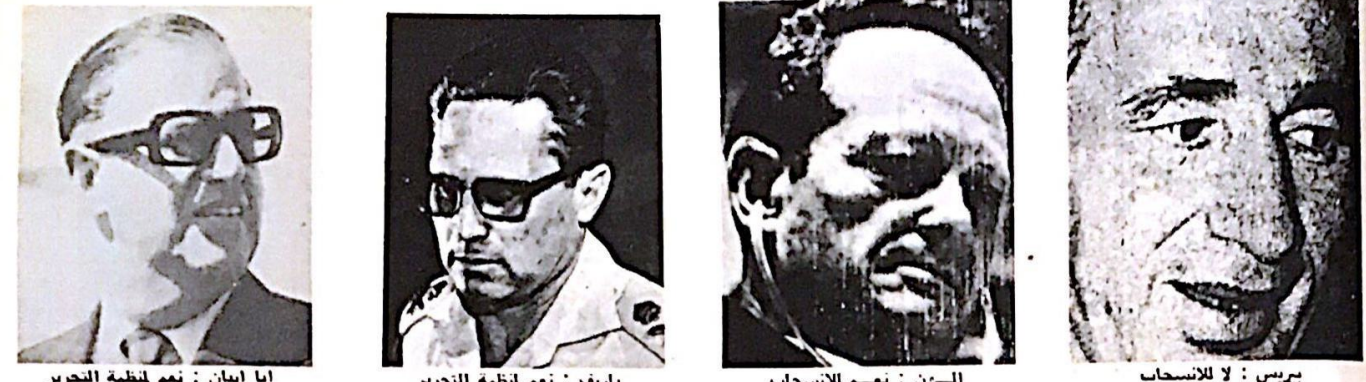
ابا ايان : نعم لمنظمة التحرير / ياريف : نعم لمنظمة التحرير / السون : نعم للانسحاب / بيريس : لا للانسحاب

في الوقت الذي يشهد فيه النظام الامبريالي ازمة تضخم حادة ، تسعى الشركات الاميركية لاقامة مصالح وعلاقات مع السوق العربية التي تضمن لها مليارات الدولارات ، كما تسعى هذه الشركات لاقامة علاقة سرية للغاية مع اسرائيل . وقد وردت عدة تقارير مؤخرا اذيعت في اذاعة العدو مفادها ، ان السيارات في مصانع نوردي تتكدس ، لذلك قام مدير الشركة بزيارة للسعودية والكويت وابو ظبي ، ولم يشعر حسب قوله بوجود قائمة سوداء او مقاطعة على بضائعه ، على الرغم من تعاون الشركة مع اسرائيل . وسأل مراسل « نيويورك تايمز » احدى مديري مصانع شركة « ريتيون » للصلب التي تنتج مركبات صواريخ هوك ، حول الوضع الجديد لديهم ، وكان الرد : « اننا نمر الان بحالة دقيقة وحساسة بتسويق منتجاتنا ، على الرغم من صفقة للسعودية بمبلغ نصف مليار دولار ، وعلينا ان نستوعب هذه الحالة . واذا كشفت لك كيفية تصرفاتنا بعلاقاتنا التجارية مع اسرائيل والدول العربية ، فان الامر سيكون بمثابة عملية انتحارية لشركتنا » .