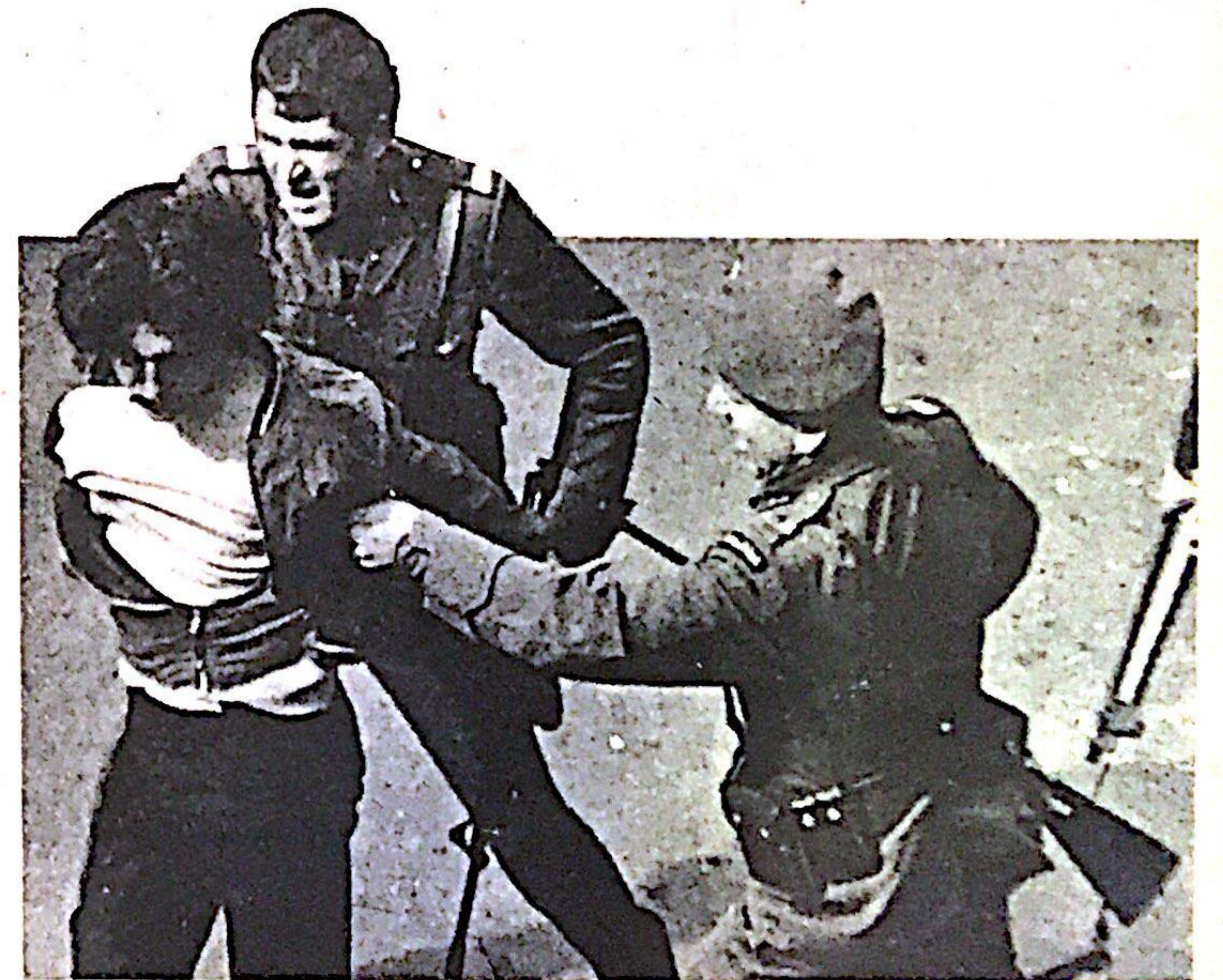
هذا هو مفهوم الديمقراطية

هذه التواريخ التي تبين لارباب السلطة حنينة نهايتهم على ايدي المستغلين والمضطهدين . كما تبين للجماهير حقيقة تاريخهم لكي يكون مشعلا يضيء لهم طريق المستقبل . فلننود هذه الاحداث والتواريخ ولندرس للاجيال الصاعدة . ■ ١٨٢٠ ثار الفلاحون على الامير بشير الثاني احتجاجا على زيادة الضرائب وامتنعوا عن تسليمها