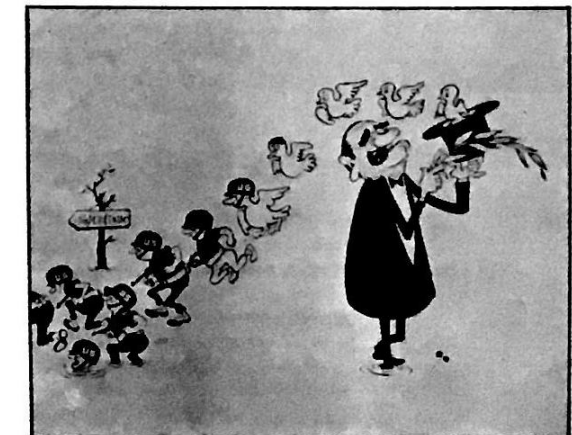
شعوبة : بالوو الجمهورية مينام ديمقراطية