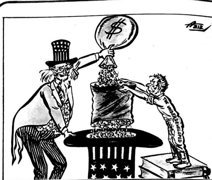
المعوية الاميركية : م. ا. عزيز (باكستان)