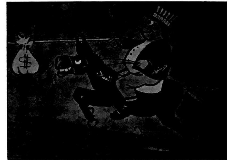
بين السيد وخادمه اسماعيل عاشور (فلسطين)