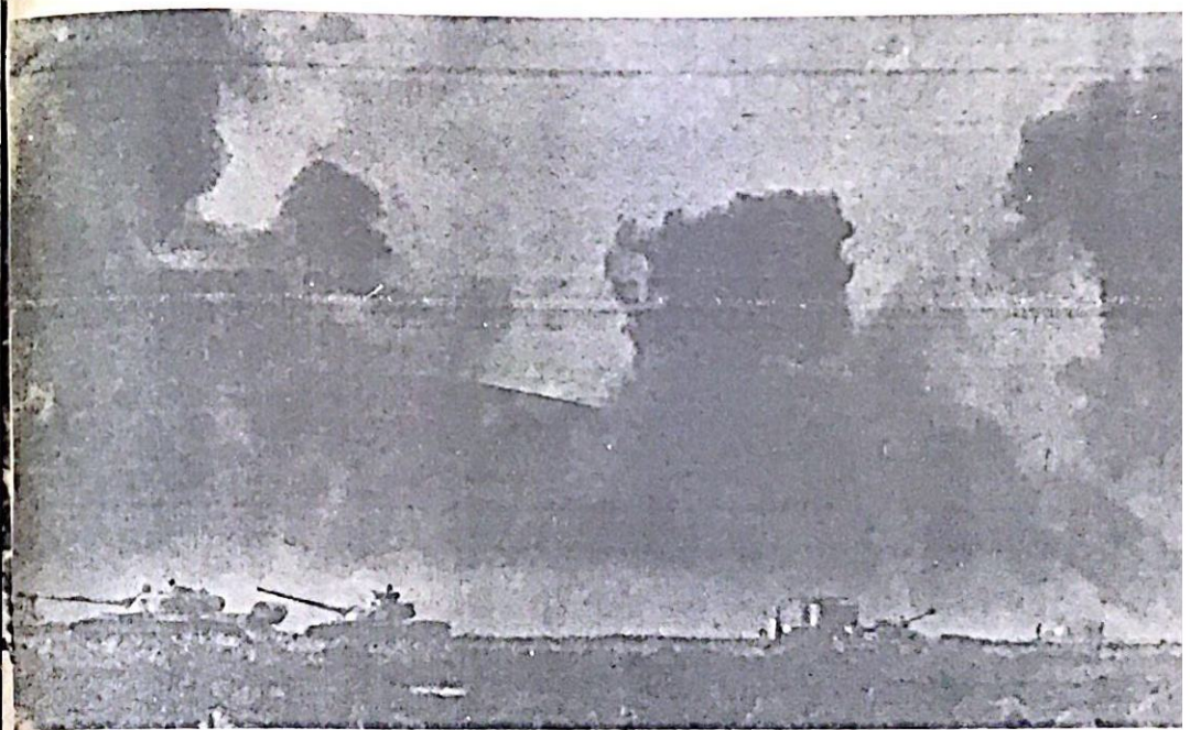
البران بمساعدة من مواقع العدو الإسرائيلي في الجولان بعد مصعبها بالدمعة السورية ، بينما تقدم الدبابات نحوها

يبين ان ذكر ان موقف الشعب السوري من قرار مجلس الأمن رقم ٢٢٨ ، قبل ان تعلن الحكومة السورية موافقها على وقف اطلاق النار ، وبعد ذلك ، كان قاسرا . عندما سجدون عنه برفقون ذلك بالحدس عن الشهادة والبطولة والصحية