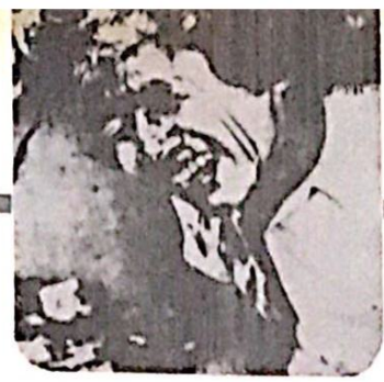
طلالة حليلة اندونيسية وقد لوتت الفناء وجهها بعد ان امهال عليها الحضور صرمانعاق السنادل

ولكن الرمن كم ابل سوبع استنجد ، في صره دراسته لحركات العدو ، ان ذلك العدو لس يكتشف مكانا نيل مضي بعض الوقت ، ووضع خطه حربه ونسائله نوبوم في نوبورت المظفومين الخدد دوبريا مركزا . وكان هذا النضم بالعمل نديبا ذكا بالظفر الى العمليات الكيرة التي كان موقعا ان تجري سبها بعد .