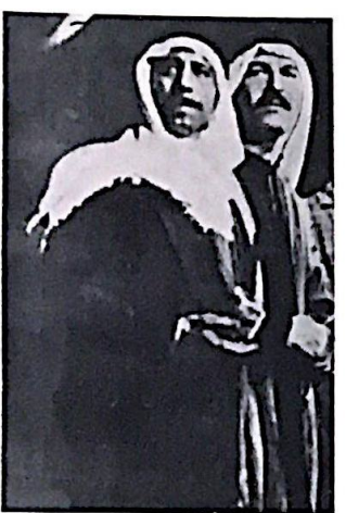
نزواني الصغرة واحلامي في مشاهدة لوحات نامل وتوحد وهذه كما اري مهمة عميرة تمكنت « حفلة سمر » من تحقيقها .. وهنا فقط يمكن سر النجاح .

كان المسرح بالنسبة لكثير من الماهدين ولغرات غير بعده لونا من الحذلقه . لونا من الادعاء بالتمتع بالثقافة والادعاء بمشاهدة التراكيب الجملة الملونة بانوار المسرح ، ومناقشة المفاهيم المسرحية التي تطرحها هذه المسرحية او تلك وحتى الابتعاد الى ما لا يهدفه المؤلف وما لا يطرحة المسرحية ..