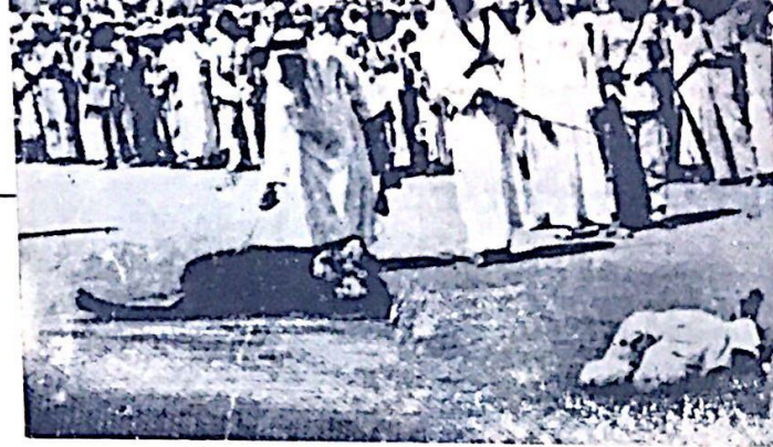
عمال نم اعدامها بعد الاضراب العمالي الذي اوقف صنع النفط الى دول المدوان لمدة خمسة عشر يوما ، أثناء المدوان الايراني العمالي على الامة العربية في صام ١٩٦٧

يكون هذا الاتحاد من العصر بل من العديد من الشيبات العالمين في الحركة الوطنية ( الشيوعيين - القوميون العرب - البعث ) وعلى وجه التحديد بتاريخ ٥٩ - ٦١ بزعامته ناصر المبيد ، متطورا من الاسم القديم لهذا التنظيم حيث كان يدعى باتحاد ابناء الجزيرة العربية ، امدت لهذا التنظيم خلايا سرية في انحاء عديدة