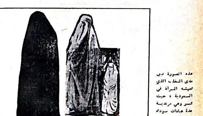
هذه الصورة بين مدى الخلف الذي تبتهه المرأة في السعوديه ، حيث تسيروهي مرتديه مده عباوات سوداه

هذا ويعبير العبيد من املاك النسخ حتى موبه ويوزعون على اسانته من بعده ، وقد لعب البيرون هو الآخر دورا في زياده العبيد نسجه الآزواه . ان تجاره الرقيق في السعوديه ليست جريمه بل هي تجاره معروفه حيث تجري عمليات البيع علنا ، ان تقوم عدد من القبائل هي الدواسر وبيره والنساصره والوجهيه بتجاره الرقيق بين المناطق المجاوره والى الرياض ومكه وجده ، ولي مكه سوق للرقيق يدعى دكه العبيد ، يصر فيه العبيد او العبيده تعالما ويسرعوا عراه واذا