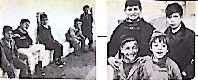
اطفال يهود في باحة مدرسة التوراة في الحارة الكبيرة في جزيرة جريا

وخلال العشرين عاما الماضية ، والخلال الحرب مع البلدان العربية . والاشكناز والسيفاريديم يتنمونها الى اطفالهم ، وبالتالي يساهمون في اذات الهوة من جيل المهاجرين الى جيل هؤلاء السيفاريديم يشكلون ٦٠ ٪ من التناخبين .