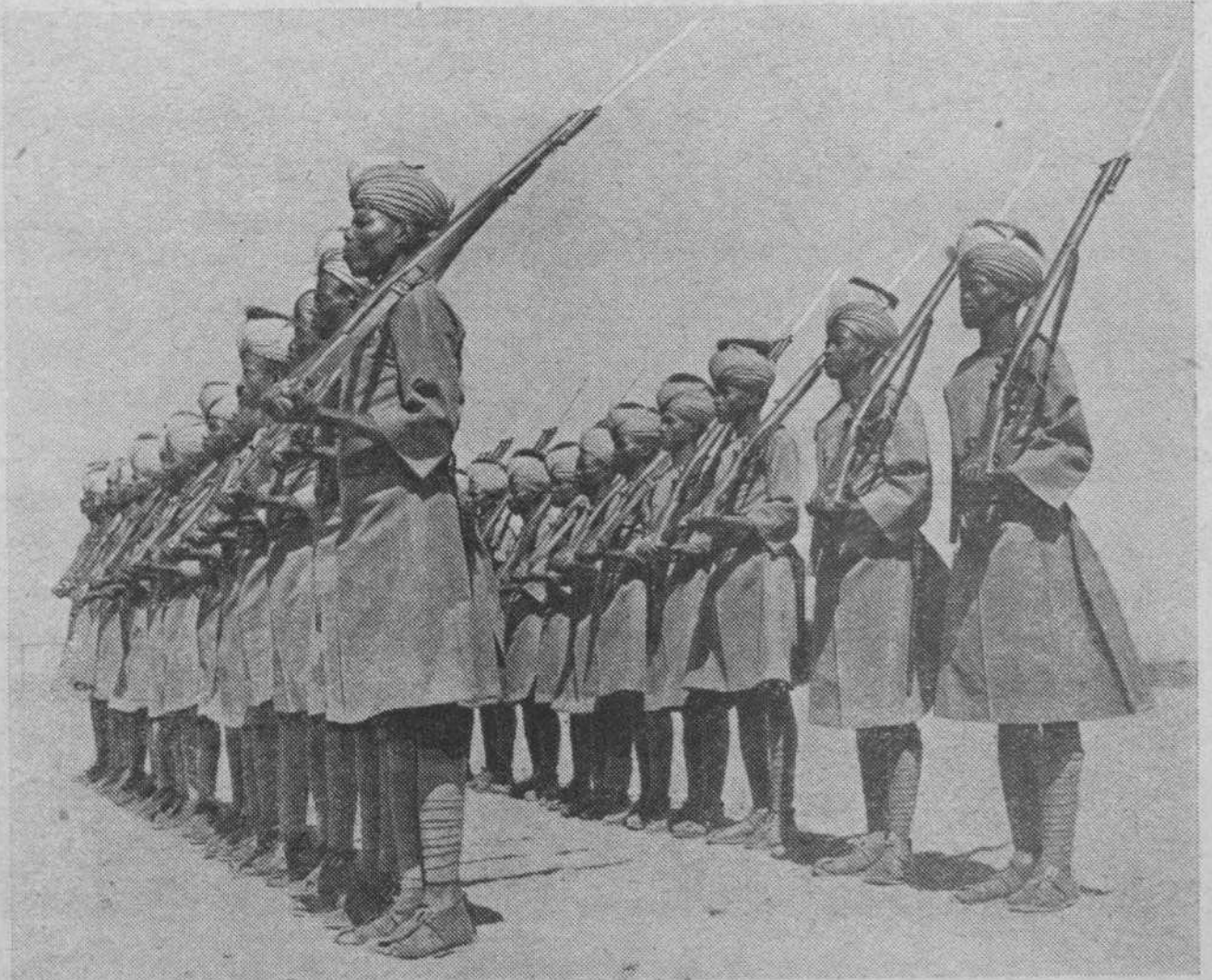
فصيلة من قوة الدفاع السودانية اثناء حفلة عرض: وهذه القوة تقوم باعمال باهرة ضد الطليان على حدود الحبشة

الوصول الى اغراضهم، وتنفيذ سياستهم ومراميمهم: اوهل بعد العهد كثيرا بالمقتلة الواسعة التي اقترفها هتلر واتباعه في المانيا في ٣٠ حزيران سنة ١٩٣٤ ؟ اولم يبرح القتل الوسيلة المعتمدة عند النازيين في الوصول الى كل غاية وتنفيذ كل خطة من خططهم ؟ اولم يذهب الدكتور عبد الرحمن شهبندر رحمه الله قتيلا بايدي شرذمة من