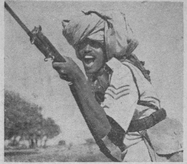
الحراب التي يرهب منها الايطاليون - شاويش في قوة الدفاع السودانية

غير ان هذا الاسبوع جاءنا بمثال واضح جلي لشمرات الحكم الذي يريد المحور اقامته خارج بلاده كرومانيا مثلا: فان رومانيا كانت فيما مضى بلادا يسودها السلام وتتمتع بالرفاهية والرخاء: غير ان النازيين قد ثقل عليهم ان يروا هذه البلاد البلقانية: تتمتع بميزاتها الملبعية والسكينة الشاملة