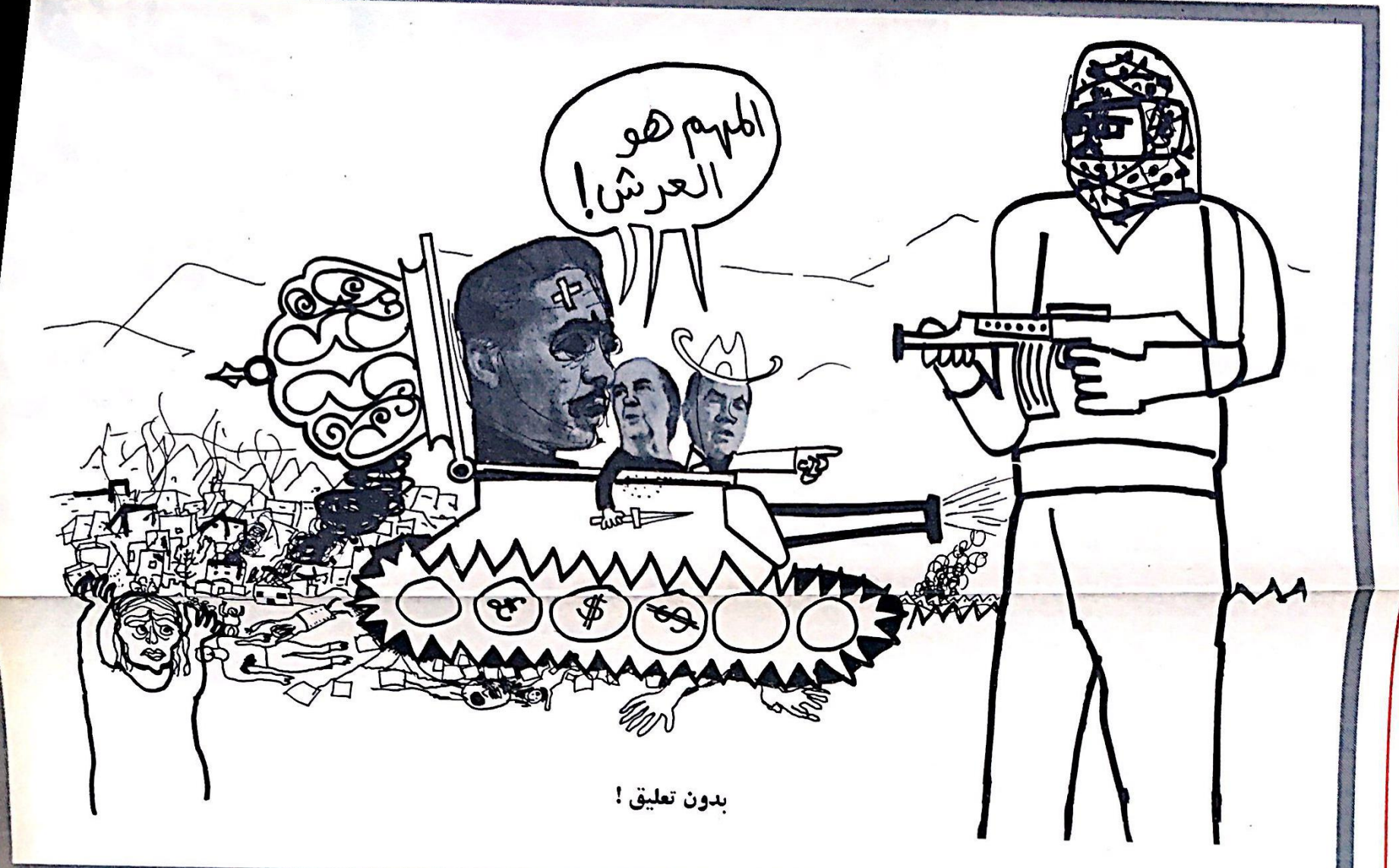
بدون تعليق !

من هو محمد داود ، رئيس حكومة الفاشست العسكرية في عمان ؟ انه رجل ضعيف الشخصية ، وقد كانت « مواهبه » كلها تنحصر في كونه ضعيف الشخصية . - فلانه ضعيف الشخصية اصر النظام الملكي على تعيينه رئيس الجناح الأردني في لجنة الهدنة المشتركة مع اسرائيل ، اذ ان ضعف شخصيته كان يضمن لمسكر العدو الإسرائيلي - الإسرائيلي - الرجعي ، تعريض كل ما يريد ! - ولانه ضعيف الشخصية استطاع الإسرائيليون تكليفه بعقد صفقات بيع أراضي مربة في المناطق الجردية من السلاح ، حيث يعود له « الفضل » في ابتلاع اسرائيل لعدة مواقع فيها . - ولانه ضعيف الشخصية جاء به الملك حسين لرئيس حكومة الفاشست ، وذلك كي يستخدمه في تنفيذ الجزرة ! ان رجلا كل مواهبه في التاريخ تلخص في ان شخصيته ضعيفة ، لا يمكن ان ينتهي الا نهاية مثل هذه ! ومنذ ١٩٦٠ حتى ٦٦ كانت مهمة محمد داود الاتصال باقرائه وابناء قريته والقرى المحيطة بها ، ليقيم معهم بنور سمسار الأراضي ، ويحرضهم على بيع اراضيهم للإسرائيليين ، وفي عام ١٩٦٣ وصل به الأمر الى حد وضع أحد اقربائه بالسجن ( ويضع هذا القريب « القبيل » بالتسوية » حوالي الـ ٧٥ سنة من العمر ) لانه رفض ان يبيع ارضه في المنطقة الجردية وظل يحتجزه في سجن القدس حتى استطاع ازاله على التنازل عن حقوقه بالأرض ! وفي نفس السنة تزوجت ابنته من شاب مهندس يعمل في الكويت ، وقد تلقى الوالد « السعيد » بأقة وود بالنسبة لمن « زملائه » القساط الإسرائيليون في لجنة الهدنة المشتركة ! « هذا هو الرجل الذي يتلخص في انه ضعيف الشخصية ، أمضى عمره بهيئة أكفأه لي يركبها ! يسوقه الى آخرته ! « ( ... )