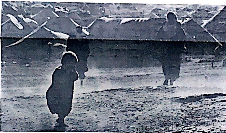
عمال المدفعية التخلي ، بمران الدبابات ، بالصواريخ الحرفه بالتانك والفوسفور ، بصدى النظام الرجعي الفاشي ، لزيادة الصمود في هذا الشعب المشرذ . . . لكنه سيعلم ، وسيكتب التاريخ ، ان هذه الغيام ، خيام الكادحين المشردين ، براءة الكادحين فيها ، ستكون اشد صمودا من قصور ولجاج ودروع العملاء . . . وعندها سيخرس الفالون بامكانيه التسوية بين تيران العملاء ولحم اليرباء