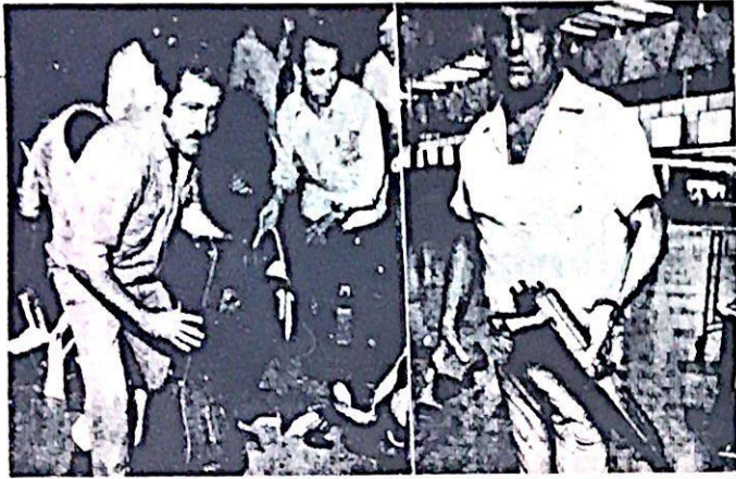
الرشاشات التي استعملها الفدائيون اليابانيون .. والحقيبة التي كان الرشاش بداخلها

الصحة افنت العالمية تسأل .. والجبهة الشعبية الشعبية تجيب .. حول : مطار اللد كصف مدني . المدنيين والعسكريين . الإجمية والنف . الرأي العام العالمي . دور اليابانيين . معركة التحرير والإجهاث الانتحارية