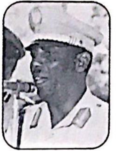
الرئيس محمد رساد بري