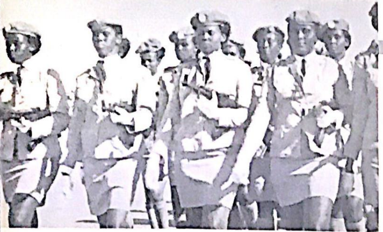
المراه في الصومال : رقص وسلاخ

فلا تكلف شيئا سوى سؤال اي مواطن في الشارع . والصومالي يكن احراما شديدا للمعامل اللطفتي ، وسبع اخبار وعملات المساومه باسمرار ولا زال الكثير من الناس يدركون جاذبه معارضة احتلال العراقيه ، ولا زالوا يسألون عن «البيان» الذي اوصحل سفر الدكتور حنين ، وقد لسب من خلال لغاهي مع الكثير من مسؤولي وكوادر الثورة الصومالية وضوح اعزض لديهم من قصة احتلال اسرائيل لشهر لنظم اللغة الصومالية ، وقد قام المكتب السياسي بدوره الفعال في نشر وتعلم اللغة الصومالية ورفع شعار «اما ان تعلم او تعلم فليس هناك طريق ثالث» . وقد حاول الكثير من اعداء الثورة الصومالية الاصطياد في الماء العكر حيث اخذوا يتسبون ان السلطة في الصومال اما تريد ان تفلح اخر ما برطها بالحرب حتى كيب اللغة الصومالية وان يمكن ان تكتبها بالعربية بدلا من اللاتينية او تعميم اللغة العربية اصلا على اساس انها لغة الدين .