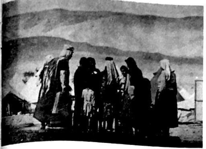
فيها ولا شوارع ولا مسافات شهوية . وطبعا دائما تخفي ادارة الوكالة وراء اسطورة العجز الذي سائر بالصومال الطبيعية فهي قرن في الخشب تزد في غير التي كل ما بت الى البشرية والهندسة والصحة صله . فلا صاه

إجازه كالمو تكلف ١٢ ألف ليرة والتلجج يكلف الوكالة ١٠ سننات يومياً حصانة المدراء الأجانب لن تجنبهم غضبة الفلسطينيين