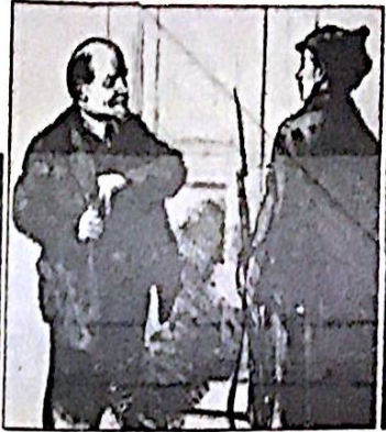
بمقام ابو عدنان