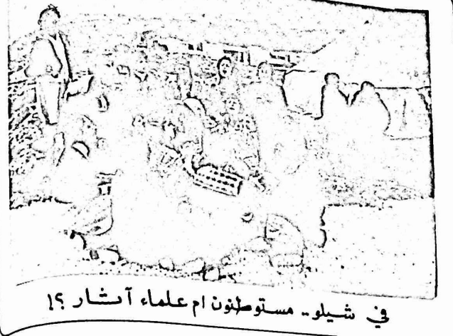
في شيلو - مستوطنون ام علماء آثار ١٩

كما اوردت الأنباء، ان الاداة المنفذة لهذه الخطة الاستيطانية، في المناطق المحتلة هي "وزارة الدفاع الاسرائيلية". وعلى ما يبدو فقد اصابت شعبة التخطيط