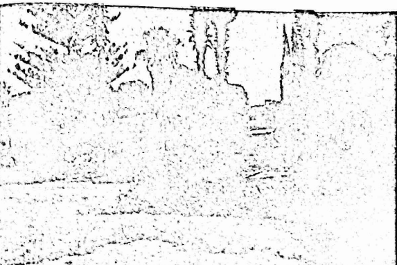
آثار مهملة لبلدية غزة - مخزنة البلدية

سحلون وزرها. وهم سوء ولون امام سكان المدن عن النواصي التي تعاني منها تلك المدن سبب نقص الموارد المادية. ونوى السمن التي سطاوول الان على بعض رؤساء البلديات وتدافع في نفس الوقت عن سياسة الحكام الذين كانوا يوعدهم او سحر، منها لرؤساء تلك البلديات هي نوى سافده وعسر معسده سطور مدثها بغير ما هي معسده باصاف الحركة الوطنية والاساءه لها.