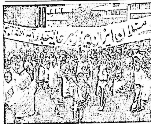
صورة للمظاهرة في مدينة قم

اوساط الجيش وخاصة الجنود الصغار والضباط من اصحاب الرتب الصغيرة وشتر هذه الوكالات الى حادثه اسدات تتكرر في الاونة الاخيرة ، وهي قيام احد الجنود بقتل قائده والانتحار بعد ذلك.