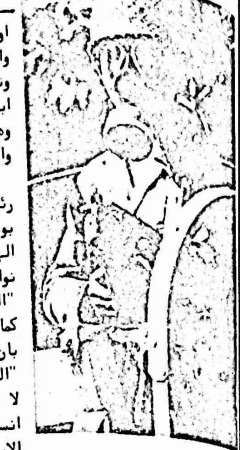
مدي ايراني يطلق الرصاص

ومن جهة اخرى اعلنت وكالات الاساء الفرنسية ان قوات الشاه، بحملة اعتقالات واسعة لم يوف لها مثيل من قبل. واكدت ان هذه الحملة شملت الوف المعارضين للشاه، بينهم النقابيون والعمال والمحامون واعضاء من مجلس حقوق الانسان وغيرهم. وانتقلت الوكالة بانه لأول مرة يات البرلمان الايراني بقتل بعض النواب ويسمونه رئيس الوزرا.