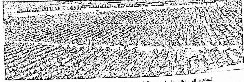
المظاهرة التي اطلق عليها جنود الشاه النيران اثنا تادية المتظاهرين لشانتر الصلاة

مهران - دعت الجبهة الوطنية في ايران الجماهير الى مواصلة النضال حتى اسقاط الشاه واعلان الجمهورية الديمقراطية في ايران. كما هاجمت الجبهة حكومة شريف امامي واتهمتها بالتكذب حول ادعاءاتها عن عودة النضال الى ايران بعد اعلان الاحكام العرفية.