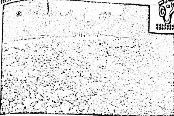
هل من خطوة تصحيح