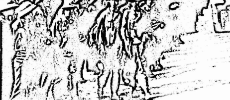
القوات الفيتنامية تنحدر لدرج مليل الفراه الصينيين

اجمع المراقبون على ان الفرزة الصينية قد منوا بهزيمة سياسية وعسكرية نتيجة عدوانهم على فيتنام وانهم لم يستطيعوا تحقيق الهدف الاساسي من عدوانهم وهو ارغام فيتنام على التوقف عن دعم النظام الثوري في كمبوديا ، وديق الاسافين