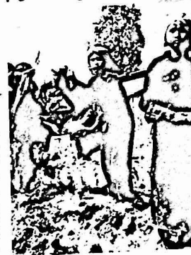
وكان على الأطفال ان يعملوا من الفجر حتى المسق

تواصل أجهزة الاعلام الامبريالية والصينية حملتها المعادية ضد انتشار الثورة في كمبودية، وفي هجومها على الصحافة الوطنية للاغراء الوطني، ادعت هذه الاجهزة في البداية بان قوات فيتنامية ضخمة قد غزت كمبوديا بان قوات المدوب الصيني في الصفحة المتحدة بان الاتحاد السوفيتي هو الذي حرض فيتنام لتشنج هذا النزوع، كما اعلن هودج لانتر الناطق بلسان البيت الابيض بان غزو كمبوديا من قبل طرف ثالث ان غير كمبوديا. ومن جهتها حاولت بعض الافلام لتسلية ان تستنح بان سقوط كمبوديا هو اثر السوفييتي على تطور الامريكى الصيني. ولا تلاحظ ان اجهزة الاعلام تلك بدلت من لجهتها المعادية لما كان يحرق في كمبوديا منذ بدا انضمام البائد وتحرش من بكتين استفزازا ضد فيتنام. وكانت مجلة السامر الامريكى قد نشرت قبل حوالي ستة قروا مورا عن مباح حكومة بول بوت ضد المدنيين الكمبوديين واسمضحت الحملة جري الامم العالي للوقوف الى جانب الشعب الكمبودى في محتته. كما زعمت في ذلك الوقت نظام بول بوت ان ريت ياروش نظام دموى عرفته بالاسم. ولكن هذه الحملة عادت في بعدها الاخير وتصلت من تقريرها السابق واروتت على لسان مراسلها في كمبوديا قوله "انه من الصعب لينا الحكم على الاتهامات الموجهة ضد كمبوديا حول ارتكاب نظام الحكم هناك جرائم وحازر جماعية ضد السكان". وطالبت ايضا بتسليم لطات الاغانة الصادرة من بول بوت قبل وبعد سقوطه. وما بينر الدهشة في هذا التبادل مجالز الدعاية الغربية للصينية تقديم ادعاءاتها بشكل سطحي. لذلك في عصر الانتصار حين ضمها لثورة دللا على تدخل امبريالية كمبوديا. ومن الطبيعي الا نتحدث تلك الاجهزة عن الاسباب الموضوعية لانهيار الربع نظام بول بوت ابتناع الجماهير الشعبية عن