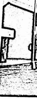
قوم بنه في ظل العيد الماكمهدنية اشاح