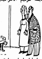
ليه يا ماما دائما تتخاتني مع بابا هوه ياخذا مصروف كام ٩٩ .

اللى الصغير قدم بلاغ الى النائب العام انور ابو سلحي ضد عصمت للسادات لارتكابه حادثة نصب خظيرة . وقرر النائب العام حفظ البلاغ المقدم ضد شقيق رئيس الجمهورية دون ان يجرى ادنى تحقيق . كرر الشاكي شكواه . . . فقرر النائب العام قراره بالحفظ . توجه مقدم البلاغ بشكوى جديدة الى وزير العدل احمد موسى الذي اشار عليها بكلمة "تحقيق" واحال الشكوى للنائب العام للتنفيذ . . . ابلى النائب العام الامر للمراجع العليا . . . فوجئ وزير العدل باستدعائه لمقابلة رئيس الجمهورية الذى عنفه تعنيفا شديدا على تصرفه قائل : "لما تسك حراية البلد كلهم وتحقق معاهم . . . ابقى تشاطر على اخوى عصمت" . بعد هذا الحادث ازداد تفاول انور ابو سلحي بحصوله على منصب وزير العدل الذى طال شوقه اليه .