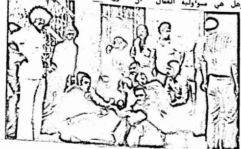
اعتصام عمال شركة كبرياء القدس

ليس هناك دار للاعمال حول الملحة الوطنية منكم مفاها فقط مجلس ادارة شركة كبرياء القدس . ومن الواجب على هؤلاء وغيرهم ان يروا التطورات الحديثة وان يروا اسراع دور الطبقة العاملة وزيادة حجمها وقوتها .