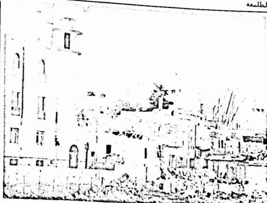
أحد الجوامع في الحي