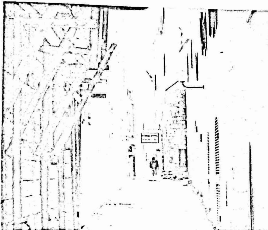
أحد الشوارع الحديدية في حي المغاربة

من أعمالها في حي المغاربة وحارة السرف بعد ان قامت بهدم حوالي ١٠٥٠ منزلاً في هدس الحسني كانت سكنتها حوالي ١٥٣٠ عائلة عربية ووطنى عائلات يهودية بدلا منها . واستمرار السطاب تركه نظير الحي اليهودي سرب الصحف بان "لجنة المراقبة على الاثار" الاسرائيلية بعزم فتح باب جديد في اسوار البلدة القديمة بهدف نقل الحركة التجارية والاقتصادية من منطقة باب الخليل والاحياء المحاورة الى منطقة الحي اليهودي الذي تعاني حتى الان من ركود تجاري طائل . وهكذا فلا يسعنا الا ان نعدم في هذا المجال بعض اللقطات والصور للذكرى وللمازح .