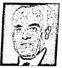
دكتور هيد عبد الشافي

أكد الدكتور حيدر عبد الشافي رئيس جمعية الهلال الاحمر في قطاع غزة ، ان الرفض والاستنكار الشبي الشامل لحادث الاعتداء على مؤسسة الهلال الاحمر يؤكد ان الجماعة التي خطفت وبغدت هذا العمل المشين هي جماعة عميلة ومزيلة . و اضاف ان حادث الاعتداء المذكور على "الهلال" كان بمثابة اعتداء على الاجماع الوطني وعلى الراي العام الوطني الذي تمثلته هذه المؤسسة . واستطرد الدكتور حيدر عبد الشافي في لقاء اجراه معه مندوب الطليعة ان توقيت عملية الهجوم والتشرب في هذا العمل بالذات لها دلالتها الخاصة ، وتأتي ضمن عملية الاعداد لفرض الحلول العمرية - الاسرائيلية ، حيث تجرى هنا مظارعة العناصر الوطنية في ابناء البلد . وعن الاسباب التي مهدت لهذا الاعتداء اجاب الدكتور حيدر الشافي ان الالتفاف الشعبي الواسع حول الهلال الاحمر وخاصة بعد الانتخابات الاخيرة ، واتساع نشاطه ليشمل مختلف مناطق القطاع قد لاقى الدعر والخوف لدى بعض العناصر الحاكمة والمشوهة ، لذلك وسد الانتخابات الماضية فقد هب عدنا عملية تحريض منظمة شارك فيها الفئات الرجعية والامملا ، كما جرت محاولات وبسبب العائمة الناجحة بانها تمثل احداث