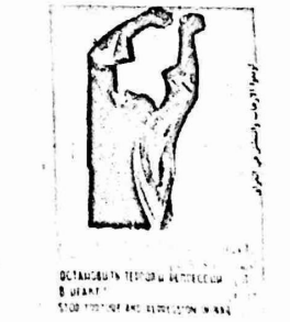
الامر المؤسف ان الحريق الاخير لبنانية الهلال الاحمر بغزة قد اتى على عدد كبير من اعمال الفنانين بالضفة والقطاع ، ومع ذلك قلن بحول ذلك دون اقامة المعرض المشترك . وقد اكدت لجنة المعارض والتنسيق ان القضية قضية وقت فقط .

قل بضعة اشهر حرى الانفاق بين مجموعة من الفنانين الفلسطينيين والمعارضين بالضفة والقطاع ، من اجل اقامة معرض مشترك يكون موضوعه القضايا الراهنة التي تهم وطننا وحققا في الحياة الحرة الكريمة . ولقد تاجلت الفكرة لبعض الوقت ذلك ان اصواتنا غير واعه اخذت تزاود معارضة الفكرة ، ولكن لجنة المعارض والتنسيق ما لبنت ان انتخابها ، ان تايقت قصة المعرض المشترك بعد ان استنارت برأى المخلصين . ان الفنانين الفلسطينيين يؤمنون بضرورة التعاون مع فنانين اسرائيليين امثال توماركن وغرشوني ومع فنانين من عرب اسرائيل كالزيميل عبد عابدى وغيره فنانين حقا والخليل . والامر المؤسف ان الحريق الاخير لبنانية الهلال الاحمر بغزة قد اتى على عدد كبير من اعمال الفنانين بالضفة والقطاع ، ومع ذلك قلن بحول ذلك دون اقامة المعرض المشترك . وقد اكدت لجنة المعارض والتنسيق ان القضية قضية وقت فقط .