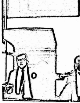
رئيس مزاد سوثيرى في لندن

بالثروة المعاصرة واضطهاد منتجيهها ، ولعلها من الجهد الاخرى تجد في امتلاك اروع اللوحات والنحف الفنية الخالدة ، ما يعجزها وقد مالت شمها للمغيب . لهذه الاسباب محتمة يهيمن اصحاب الملايين و"وجوه" المجتمع وكبار الصناعيين وموردو السلاح وطوكو البترول في الغرب ، على المزادات في اسواق التحف . ولاعطاء فكرة عن ضخامة الثروات الموظفة في تجارة الفن يكفي الإشارة الى ان مزادى سوثيرى وكريستى في لندن قد باعا في مزادات العام الماضى لوحده ، بـ ٧٠٢ مليون دولار . • هذا وفي الخامس من تشرين ثانى نوفمبر الماضى بيعت بمزاد