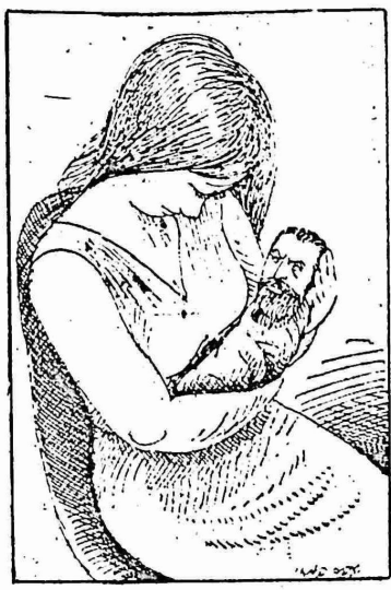
الولد الذي يصفر

٥ - نقص في كمية وانواع الادوية المتوفرة - وانثار الدكتور