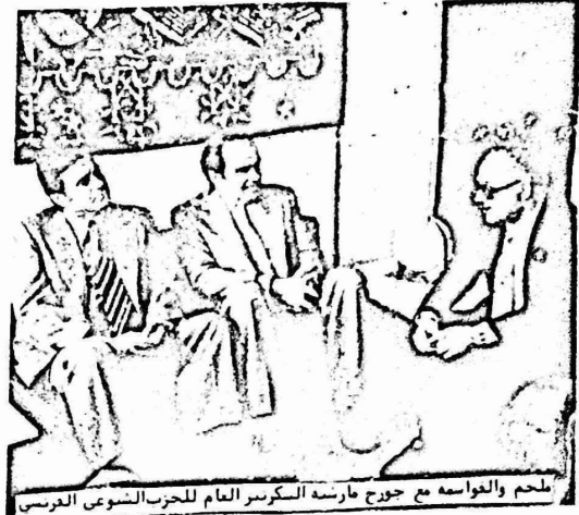
ملحم والقواسمه مع جورج مارسة السكرسبر العام للحزب الشيوعي الفرنسي

وردت المحامه لاضر على ادعاءات غير شيل ناح بان عوده المسعدس الثلاثة للممول امام المحكمه بانها كانت بقلها - في حسه ادعاء ان اجلا الملون موربه كانت وذلك للانسار على المحكمه . اما الحقيقه فهي ان الكانتره تكن في محارزه القاوب وبالقول " ان الامن قوق الدستور " هذا ، ما اعلمه سارون وهذا ما عبه من الصغر لذي سقده عملة الطرد . واعلمت المحامه ، بالانساد الي ما فاته الصرع الانداسي في السد ١١٢ (٨) ان عدم قبول المسعد امام لجنة الاستنفا العسكريه بحمل الفرار عبر باوسى وباطلا . وهذا حاول الادعاء الانكار على هذا السند باصرا ان عدم المحامه بصرحا امام اللجنة العسكريه دون حضور المسعدس . فطالت المحامه لاضر : ان هذا الاصراف حا ، اعطاء التسريعه لمل عمل عرفاوبوسى .