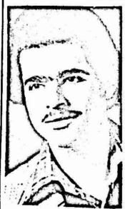
نهضة بالشفا والعودة للعمل

بمر الصيف غالباً ومعظم شباننا يلهون ويستكفون . صحيح ان البعض منهم يحاول الارتياح عن طريق العمل .. لكن معظمهم يظل بدون عمل ، والغريب في الامر ان معظم جمعياتنا الخيرية ، وادبنتنا ، تكون في بعد عن شباننا .. علماً بان لها من المشاريع المسطرة على الورق الكثير .. فلم لا تستغل طاقة الشباب في مشاريع عمل ، من اجل الصالح العام ، او من اجل صالح المؤسسة نفسها .. وصحيح ان مديرية التعليم تعمل اسابيع ترفيهمه بالتنسيق مع بلدية غزة لطلبة الابتدائية فقط، وحتى هذه الاسابيع لا يرحى منها خيراً ، لانها في حد ذاتها مجرد دعابة مقصودة ، وتقتصر على دق لطبول والدقوف .. ناهيك عن المفارقات العجيبة التي تحدث فيها .. لكن ماكاننا عمل اسابيع تطوعية من اجل انجاز مشاريع عامة وخاصة ، يكون الهدف منها مصلحة الهيئة او الجمعية ذاتها .. واستقطاب الشباب من جهة اخرى .. وهذا بالطبع يتم عن طريق التعاون مع اندية القطاع .. فلم لا يعمل مشروع باسم النادي الاهلي .. او باسم النادي الرياضي .. او جمعية الهلال الاحمر ، ولم لا تكون لجنة عمل تطوعي لكل ناد ومؤسسة على غرار اللجنة المكونة بجمعية الهلال الاحمر ..؟؟ يجب ان لا يضيع جهد الشباب هباءً وهدرًا على كراسي المقاهي ، وعلى طاقي البحر .. لا بد من التفكير جدياً في مشاريع تحفظ للشباب كرامته ، ولبلبل عزتها .