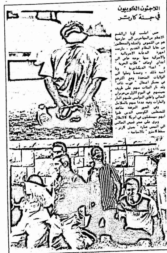
الاجتثاث الكويون في جنة كارتر

والمستوى الرسمي. وبسبب الاحصائيات الرسمية في سنة ١٩٧٨، بلغ الدخل القومي في ذلك التحويلات الواردة الاردنيين المتفرسين في الخارج (٧١٤) مليون دينار. فاذا لم هذا الدخل بالتساوي على ارض النصف البالغ عددهم نحو ١٥ نسمة، فان حصة الشخص احد من الدخل القومي الاجمالي بنحو ٤٧٠ ديناراً (٣٥٧) ديناراً اي بنحو ٢٠ دينار شهرياً. واذا لم ان معدل الاسرة الاردنية هو (٦) شخص، فان متوسط حصة الفرد من الدخل القومي الاجمالي بنحو حوالي (٧٧) دينار سنوياً. بما يقارب (١٩٢) دينار شهرياً. ما يقرنا بدخول ثقات عديدة من ايلات الاردنية، فانها لن تصل الى هذا الحد المتوسط، لسه العمال لا تتجاوز دخولهم الخمين ديناراً شهرياً