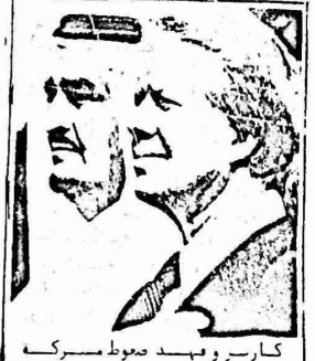
كارتر وفهد صوط مبرك

ادعى بريجنسكي مستشار كارتر لشؤون الامن القومي في حديث لمراسل صحف "نيويورك تايمز" بان الولايات المتحدة تحاول في المرحلة الحاليه تعزيز الاستقرار والامن في منطقة الشرق الاوسط . وحول عدم رغبه باكستان وعدد من الدول العربيه مثل العربيه السعوديه تشكيل حلف للامن يرتبط مع واشنطن بسبب شكوكها في قدرة الادارة الامريكانيه على الوفاء بالتزاماتها أكد بريجنسكي : " ان هذه الدول تزيد وجودا امريكانيا ثابتا وقويا في المنطقه ، الا انها في نفس الوقت لا تريد ان ترتبط بشكل صريح بالقوى الغربيه وان تستصنف قواعدها احببها على اراضيها ، بل انها تفضل وجود ترتيبات ضمنيه وغير مباشره ، تستطيع من خلالها ضمان امنها " . واضاف بريجنسكي " علينا ان نلاحظ هنا باننا نتعامل مع طائره ثابله وعميقه وهذا يتطلب منا نفعا شاملا وعمقا حتى نستطيع انحاح استراتيجيتنا العالميه " .