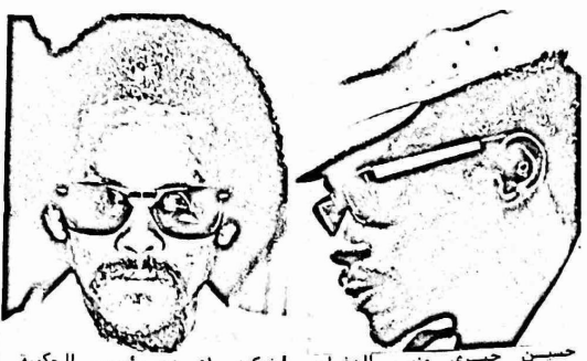
حسن حبري وزير الدفاع | غوكوني اوبدي رئيس الحكومة

ما زالت الاسناباك الدائمة مستمرة في شاد وستحل خاص في العاصمة انجاسا، وصلت الى الان جميع الواسطات من اجل التوصل الى وقف اطلاق النار بين قوات الرئيس غوكوني اوبدي وقوات وزير الدفاع حسن حبري. وما يذكر ان غوكوني اوبدي قد عين رئيسا للشاد بعد مؤتمر المصالحة في نيجيريا في العام الماضي والذي وضع حدا للنزاع المسلح في ذلك الوقت. وقد تمكن حسن حبري بعد هذه المصالحة او بتدخلها من التخلص من سافته الرئيس الجنرال مالوم . وما يذكر ان حسن حبري قد بدأ بحيازة كوفظ صفر في ظل الاستعمار الفرنسي للشاد ثم اخذ يترقى حتى اصبح مديرا لاحدى المعاطلات ارسيل بعدها الى فرنسا للدراسة في كلية الادارة وهي من الرافق معاهد فرنسا ، وانضم بعد عودته ويطلب من الفرنسيين الى جبهة فرولينا محاولا خلق انشقاق في داخلها الا ان امره اقتض وطرد من الجبهة . وقد جهد حبري بعد مؤتمر