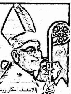
الاستاذ اسكار روسيرو