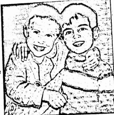
اسئتي عام الطفل العالمي ولكن مضمونه اساسي لا يزال مستمرا وخرج منح اطفال العالم السعادة والهناء والسلام . كي نعلو الابتسامة وجوههم دائمة

اسباب شفاع الشمس من وراء الاكمة حيث كان هناك كوكب العم ابو نعمان احسن ابو نعمان دفن النضاع طعام مهولا مصادرا اولاده وروحته . - بلله . الشمس جارت في مسحف السما مالكم بمساح . هزلت ام صمان خارج الكوكب ووضعت الرديعة على الحمار والعلف للدجاجات . وبعد انتهائها من عملها هذا دخلت داخل الكوكب موجدة اسئها جليله قد حصرت طعام الاطيار وطعام الرحلة التي سدا بعد فلفل . رك ابو نعمان حماره ووضع اسه الصغر امامه وسارت زوجته واسنه جليله من ورائه . وسار الجميع حو كرم الزيتون ومع مسيرتهما سارت الامال تراقق السائرئين الا ان الام سمنان ان يجمعا اكثر فسط مكن من حب الزيتون .. اما جليله فقد كانت تخلم بشي آخر .. لقد كانت تتحسى ان تصل الكرم بسرعة لري فارس . حيث ان كرمهم قريب من كرمهم . ولهذا كانت تحس برغبة حارة نحو العمل وهي ترى فارس يسلك السلم ويقطف حبات الزيتون مهاره وقوه وصدى اغانيه الشمسية يزدد في اجواء الكروم المتراصة الاطراف اما اوها الصغبر فكان بعد الحظ لبيدا صيد العاصفر واخيرا وصلت القافلة المكونه من لي نعمان وعائلته .. وبدا كل سبح عمله على تفريد الطيور الجميلة وانشاء انهمكهما في العمل وعلى غير عادتهم جاءت سيارة سرعة من اقصى السهل المشرف على كرم الزيتون .. وبعد دقائق بونت السيارة وبقي الاشخاص داخلها ومن ثم خرجوا . وفي بنده اللحظة كان الاولاد قد وصلوا الي السيارة حين ابصروها من بعيد