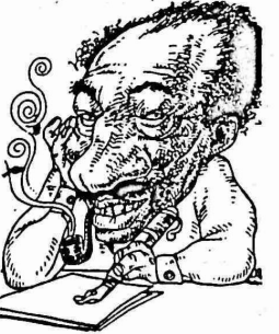
الافغانين الخارجين على النظام الثوري.

احتفلت جبهة التحرير البحرينية بالذكرى الـ ٢٥ لتأسيسها ولقد جرت هذه الاحتفالات في اماكن مختلفة خارج البحرين وحضرها قادة الجبهة وممثلون عن الاحزاب الوطنية والتقدمية العربية والعالمية. واكد محمد الشاعر ممثل منظمة التحرير الفلسطينية خلال الاجتماع الاحتفالي الذي جرى في موسكو بهذه المناسبة بان العلاقات