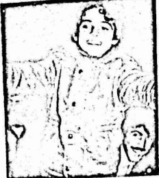
ميدالية الشجاعة والطفل مسكنا اللذان نتحدثان عن بطولة الاطفال

قال الاولاد لبعضهم . - انهم لسوا عربا انهم عربا برطوبون بكلام غير مفهوم ولكن احد هو لا . العربا . كان يفهم العليل من المرسة فسأل بلده ريكته : - لمن الارض يا اولاد؟؟ فصاحوا مره واحده .. لكه لم يفهم واعاد السؤال عليهم واخيرا عرف انها ارض متاع (مشتركة) والسعت فحاة الي واحد من الاولاد صحك ويقول متعجب . - يا الله ما اطول لحمه سار الاشخاص ومهم لغف من الاختبا الرقيقة والاوراق المبرومة وسار من ورائهم الاولاد وكاتبهم في زفة عربس . وحين وصلهم الي ابي نعمان بادره الذي يقفهم العرسة قائلا . - صباح الخير يا عم فرد عليه باحسن منها واستمر في عمله وتخلل في ذهنه اشياء كثيرة جدا لا يد انهم برطوبون شرا زنتون لا اظن ذلك اكيد مرشدون زراعة واستقر على هذا الرأي وهو يخاطب نفسه . وفي هذه الاثناء كان الرجال الازريه قد بدأوا بمسح الارض فالفتت ابو نعمان عليهم فجاه قالا - ماذا تريدون ان نعملوا هنا ومن انتم؟؟ فاجابه احدهم (وعد اخراج من حسه ورقة): - نفضل يا حاج هذه الارض مصادرة وانت مخبر اما ان تنسج واما ان تخرج حالا ونصيحة اخوية لك ولكل من له ارض هنا ان يكسب ثمنها ويخرج . وهنا ثارت نائره ابي نعمان بعد التوسل والرجاء المقطوع من اللحم فاخذ يتهدد ويتوعد لن ابيعها ولن تاخذوها . فراحوا يهزأون منه فاخذه الحماص وحمل فاسا وانجه صوبهم والغضب في عينيه