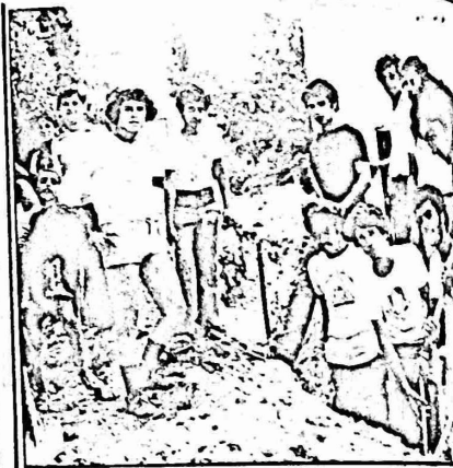
بالجدة والاصرار .. ننسي ونعمر

كما وردت في البيان المشوه اياه اسما لجان عمل او مؤسسات لا وجود لها . وجاء في البيان ان جامعة بيروت قررت عدم الاشتراك رسميا في المخيم (الجامعة لم تعلن ذلك والمجلس شارك بنشاط وفي الناصرة اطلق اسم بيروت على احد الشوارع المنجزة في المخيم تقديرا لجهود الفرقة التي شاركت من بيروت) . كما جرت الاثارة في حفل الاختتام بجهود المتطوعين من نادي الموظفين بشكل خاص (شارك من النادي ٧٠ متطوعا انسحب منهم ٣ وبقي ٦٧ حتى آخر ايام المخيم) . وهكذا يلتقي هذا البيان وملفقوه مع محاولات افشال المخيم في هذا الوقت الذي يعتبر فيه رئيس بلدية الناصرة مستهدفا ، والناصره بجبهتها وجماهيرها مستهدفة ويتضح من الحقائق السابقة كذب وزيف البيان والادعاءات الواردة فيه .