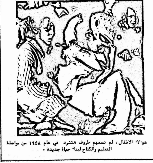
هؤلاء الاطفال ، لم تمنعهم ظروف اشتداد في عام ١٩٤٨ من مواصلة التعليم والكفاح لحياتهم الجديدة .

كاتب الحبيبة الديمقراطية قد وصفت حسن برنامج عملنا الانتخابي لعام ١٩٧٥ في الناصرة ، ضرورة اشاء جامعة عربية . واعلن توفيق زباد رئيس بلدية الناصرة الديمقراطية في افتتاحه لمخيم العمل الملغوب الخامس في الناصرة .. " ان مثل هؤلاء الطلبة الذين نفتخر بانهم جزء من نعمنا واهم يتصدون بشجاعة فائقة لكل الهجمات القاسية التي يتعرضون لها في الجامعات التي يدرسون فيها حاليا ،