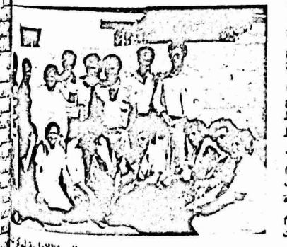
الطواقم الطبي لنقابة المقاصد مع الهيئة الادارية للمخيم

لمخيم الجلزون بتاريخ ١١ تموز ، حيث قدمت العلاج الكامل الى ٢٠٠ طفل ، كما قدمت الى هؤلاء الاطفال الادوية اللازمة مجانا ، ومن الجدير بالذكر ان اللجنة عملت داخل مسجد المخيم بسبب صعوبة الوصول للمخيم داخل المركز الصحي التابع للوكالة بحجة ان اطفال المخيم لا يحتاجون الى العلاج . وشير اهالي المخيم في هذا المجال الى حقيقة خلو عيادتهم مركز