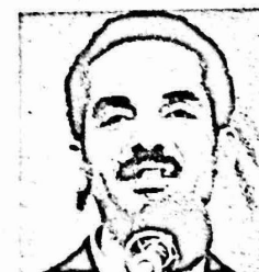
محمد علي رجائي الرئيس المكلف

وتحاول بعض الاوساط الغربية ان تقارن سبعا بين مصير الحكومة الجديدة ومصير حكومة ساذرجان السابقة ، وذلك على الرغم من تفاوت الظروف خاصة وان تصاعد النضال الشعبي المعادي للامبريالية هو الذي ادى الى