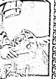
ما زالت اصوات افكاره تتمتع في السفلة التي تتمتع للحدود الافغانية في السخيمات حيث جرى في العناصر المتناوذة للثورة ضد التدمير الاجانب للقيام بتخريرية، بل في قري ما باللاجئين الافغان. وهذه ليست مجرد تدريب عادي، بل يشترك معها ما تقوم به الصحابيات المتناوذة للثورة، التي تتخلص من كل العناصر المزعوم فيها!

احد رجال ريفان في خدمة جنوب افريقيا. وقع ستيفورت سبيس اتفلاق وساعدة مع حكومة افريقيا، لتقوم في شركة العمل التي يمتلكها وساعدة جنوب افريقيا بتقسيم ساحة تامينها. ويلازم هذا العقد بمساعدة باقامة علاقة مع افريقيا باقامة علاقة مع افريقيا في الولايات المتحدة كعضوا الكونغرس الاميريكي. بل ان تذكر، ان سبيس قد عمل مستشارا للرئيس الحالي رونالد ريفان، سبقتا ١٥٠.٠٠٠ دولار من جرا هذا الاتفاق.