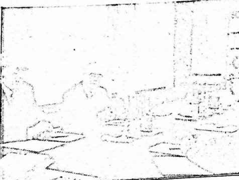
دريوبوب حور اجسامه مع داسال اورنجا رئيس الحكومة النورية في نيكاراغوا... الدعم السوفيتي اكبر ضمانه لرد العدوان الاميريكي

تحدث فيه ريفان عن القواعد السوفيتية، كانت "ادارته" تنجز الاعمال النهائية لاقامة قاعدة عسكرية امريكية جديدة هندوراس لقاموا ما وصفته وسائل الاعلام الغربية "بحرب العصابات المتصاعدة في القارة اللاتينية". ومن هنا فان الاهداف الحقيقية للادارة الامريكية باتت واضحة وكشوفة للقاصي قبل الداني، فالحدث عن الخطر السوفيتي يهدف لضعاقة ترسانة الاسلحة الامريكية وتلبية احتياجات اتكارات السلاح بعبود جديدة تصل الى الابلين من الدولارات، والحديث عن "القواعد السوفيتية" يهدف لتوتر وسباق التسليح وتهيئة الاجواء لشن الاعتداءات على الشعوب الاخرى.