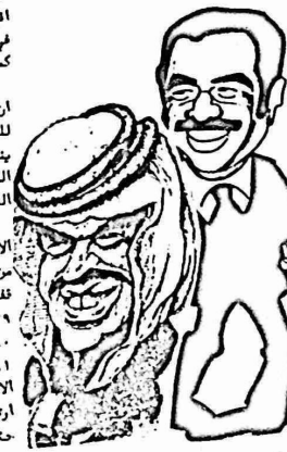
والكويت ودول الخليج الاخرى بعد ان انخفض تصدير النفط العراقي الى ٧٥٠ الف برميل يوميا فقط نتيجة لاطلاق مرفاي التصدير على الخليج واغلاق انبوب النفط العربي سوريا.

ومنذ شهر ايلول ١٩٨٠ موعد بد الحرب العراقية الايرانية اصبح العراق يعتمد في معيخته على المساعدات المالية من السعودية