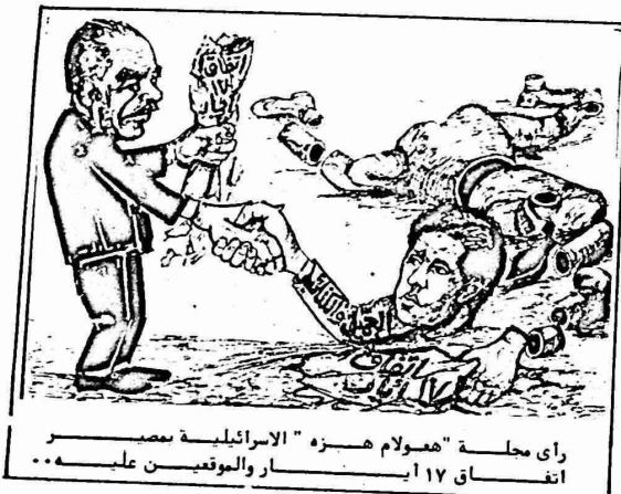
راى مجلة "هولوم هزر" الاسرائيلية بمصر انتفاق ١٧ ابيسار والموقمين عليه..

ريغان يحاول عبثاً "إنقاذ ما يمكن إنقاذه"